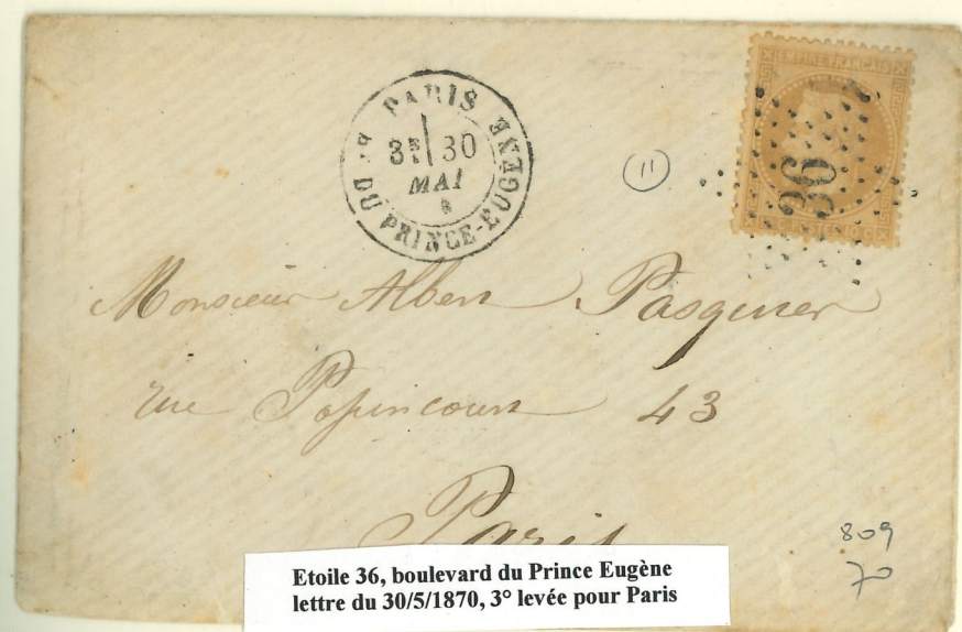
Etoile 36, boulevard du Prince Eugène lettre du 30/5/1870, 3 e levée pour Paris