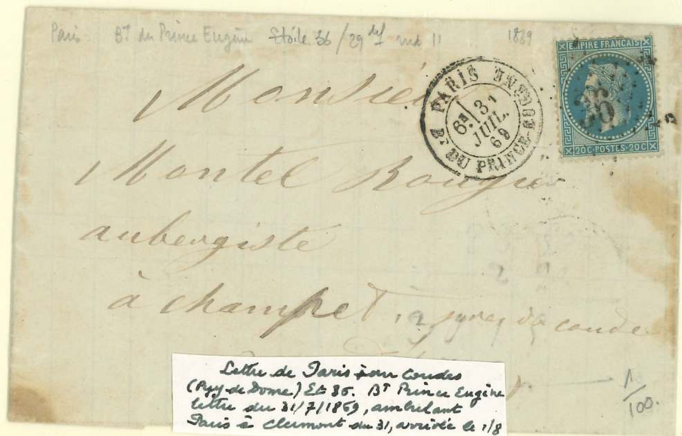
Lettre de Paris pour Coudes (App. de dome.) Et 85. 13 e Prince Eugène lettre du 31/7/1869, arrivée à Paris à Clermont du 31, arrivée à 1/8