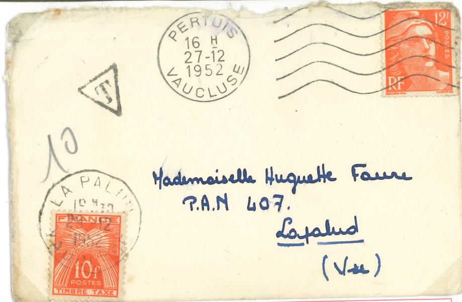
Lettre du 27.12.1952 affranchie à 12f Insuffisance de 3f, lettre taxée à 10f, minimum de taxation