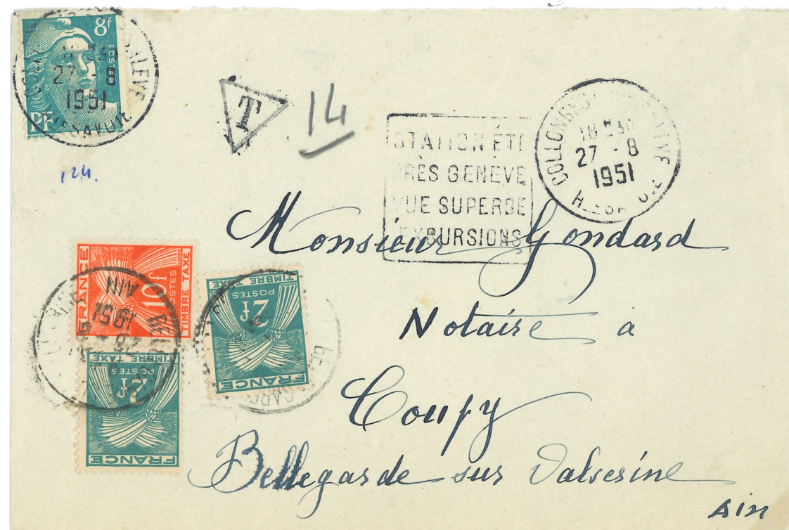
Lettre du 27.8.1951 affranchie à 8f (tarif carte postale 5 mots) Taxée à 14f ; double de l'insuffisance