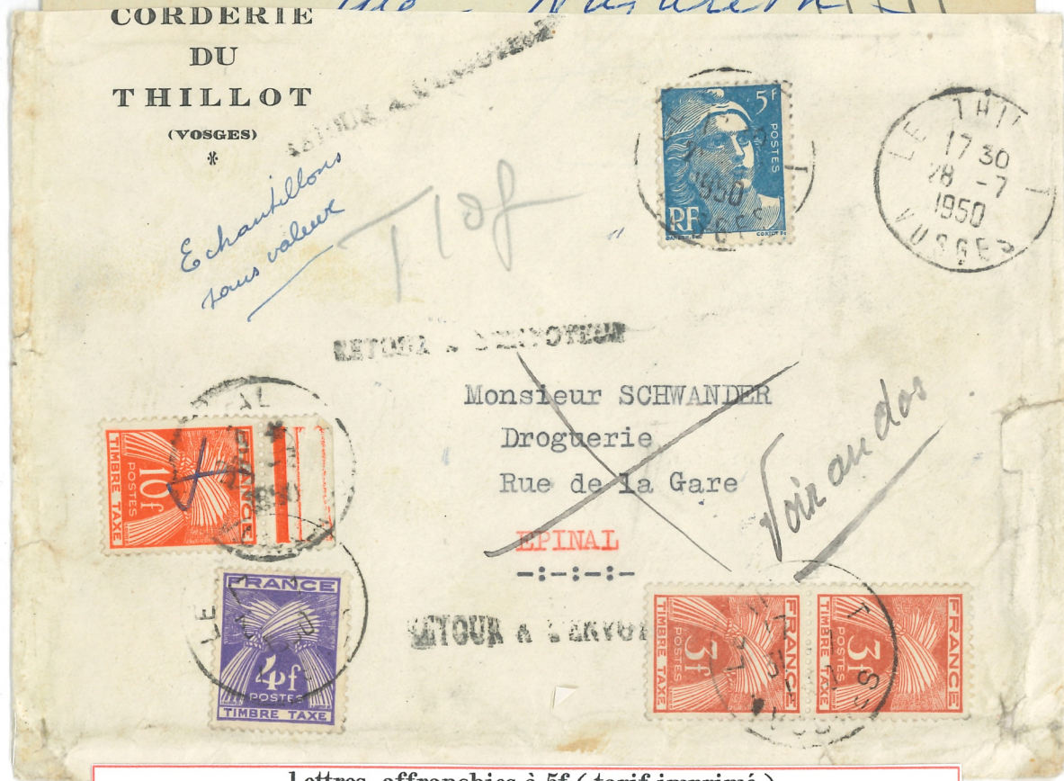
Lettres affranchies à 5f (tarif imprimé) Taxées à 20f ; double de l'insuffisance