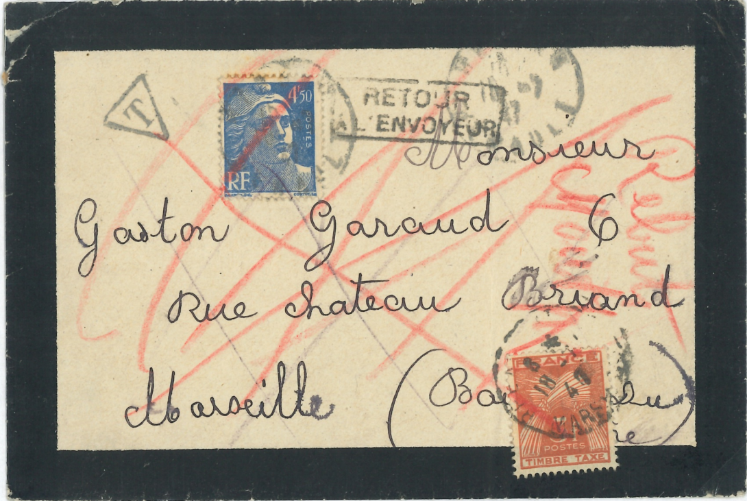
Lettre du 15 juillet 1947 taxée pour affranchissement insuffisant (méconnaissance nouveau tarif) Taxe de 3f (double de l'insuffisance) (6 - 4,5) x 2