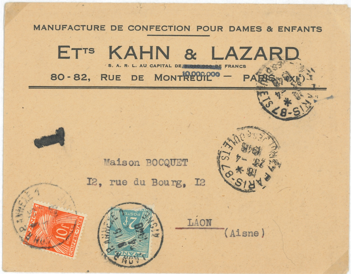
Lettre du 23 avril 1948 non affranchie Taxe de 12f (double de l'insuffisance)