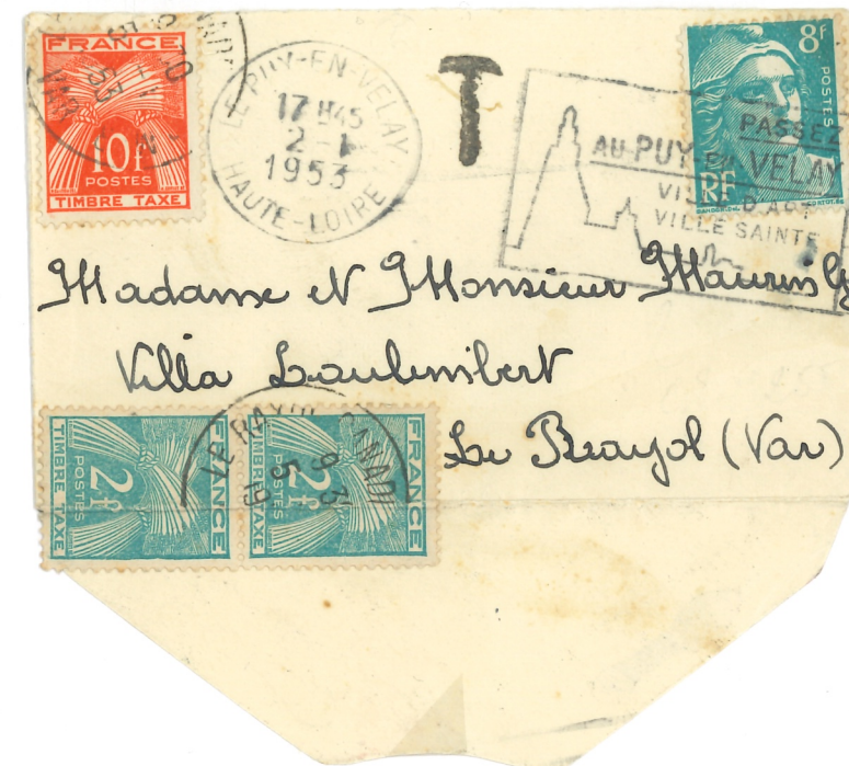
Lettre du 2.1.1953 affranchie à 8f - Tarif carte de visite 5 mots Taxée à 14f ; double de l'insuffisance ( Au vu du contenu le postier a considéré qu'elle relevait du tarif lettre ordinaire )