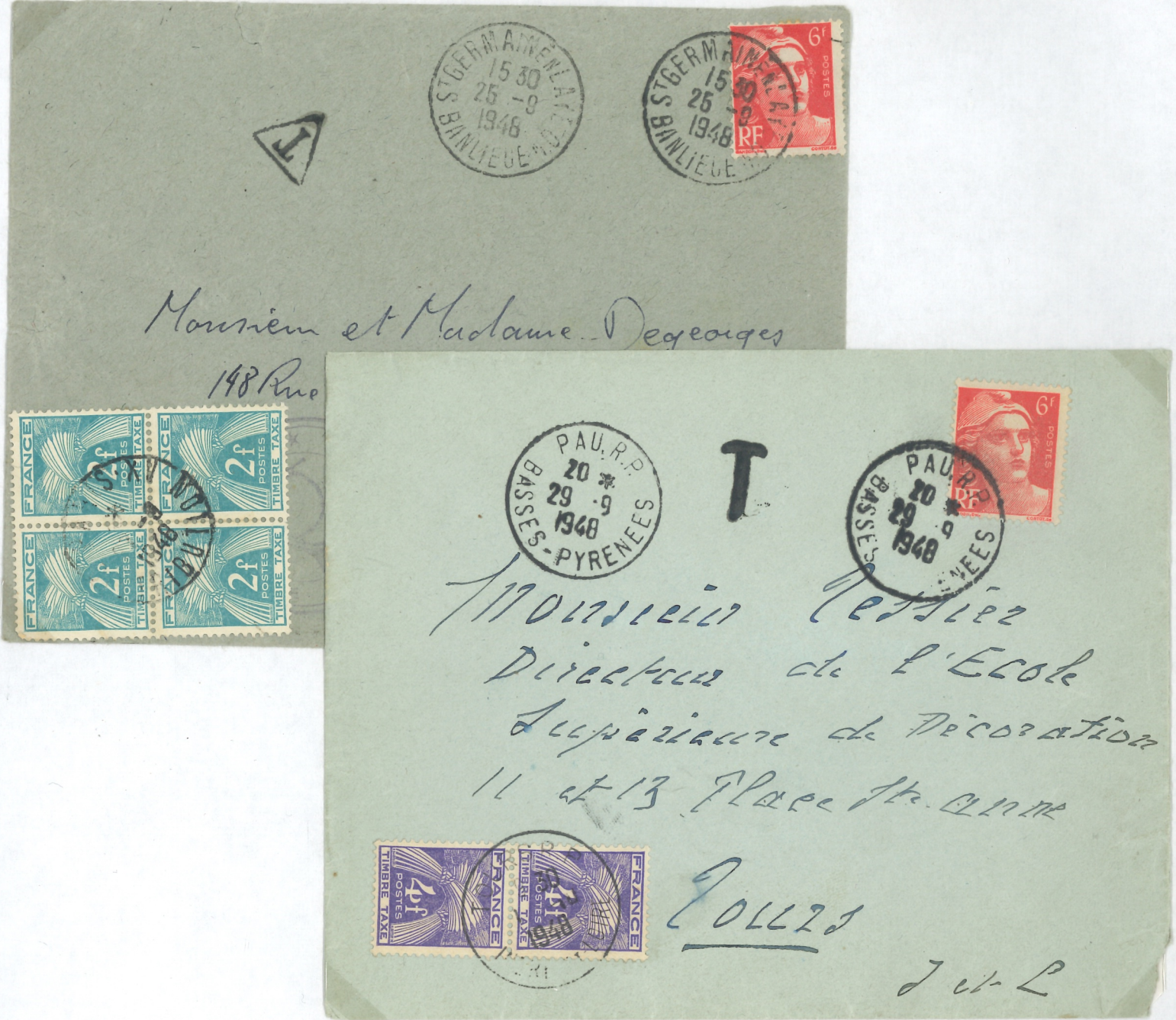
Lettres des 25 & 29 septembre insuffisamment affranchies Taxe de 4f - Double de l'insuffisance (méconnaissance changt tarif)