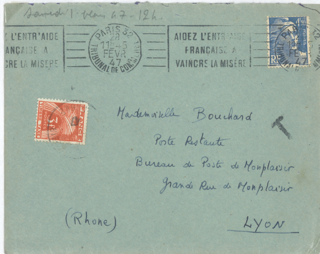
Lettre du 28 février 47 - Taxe 3f pour poste restante