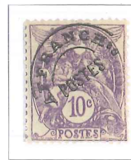
n° 43, 10 c. violet (II).