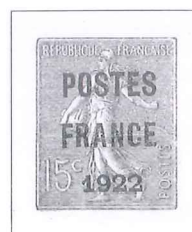
n° 37, 15 c. olive.