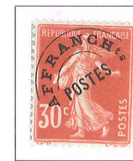
n° 59, 30 c. rose (I).