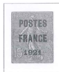
n° 34, 15 c. vert-olive.