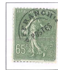
n° 49, 65 c. olive.