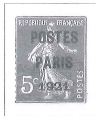
n° 26, 5 c. vert.