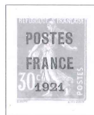
n° 35, 30 c. orange.