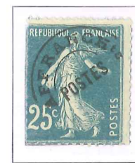
n° 56, 25 c. bleu (III).