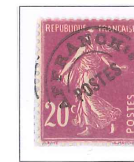
n° 55, 20 c. lilas-rose (III).