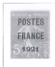
n° 33, 5 c. orange.