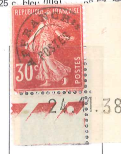
n° 61, 30 c. rouge sombre (IIA).