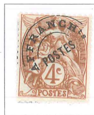
n° 40, 4 c. brun (I).