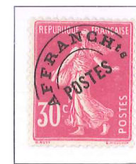
n° 58, 30 c. rouge.