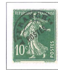
n° 51, 10 c. vert (III).