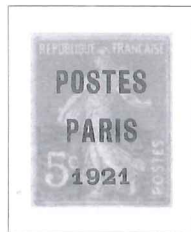
n° 27, 5 c. orange.