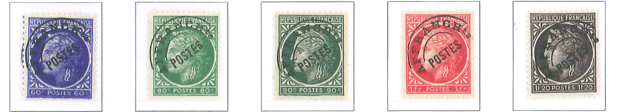
n° 87, 60 c. outremer. n° 88, 80 c. vert-jaune. n° 89, 90 c. vert. n° 90, 1 f. rose-rouge. n° 91, 1 f. 20, brun-noir.