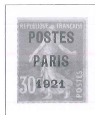
n° 29, 30 c. orange.