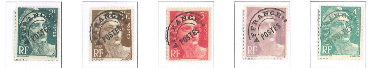
n° 94, 2 f. vert. n° 95, 2 f. 50, brun. n° 96, 3 f. rose. n° 97, 4 f. violet. n° 98, 4 f. émeraude.