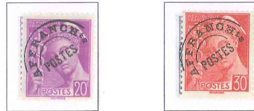
n° 78, 20 c. lilas (I). n° 79, 30 c. rouge (I).