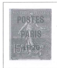
n° 25, 15 c. vert-olive.