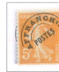
n° 50, 5 c. orange (I).