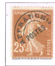
n° 57, 25 c. jaune-brun (IIIB).