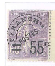
n° 47, 55 c. s. 60 c. violet.