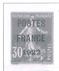
n° 38, 30 c. rouge.