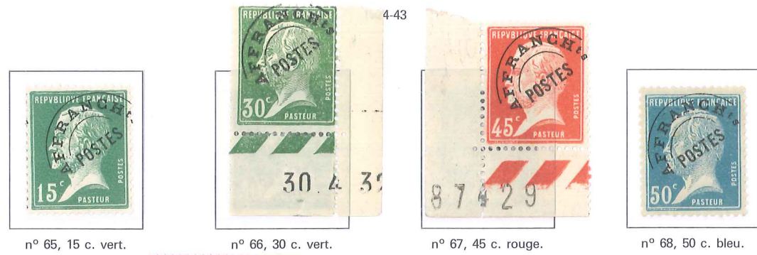
n° 65, 15 c. vert. n° 66, 30 c. vert. n° 67, 45 c. rouge. n° 68, 50 c. bleu.