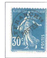
n° 60, 30 c. bleu (IIA).