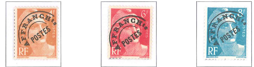
n° 99, 4 f. orange. n° 100, 6 f. rose carminé. n° 101, 8 f. bleu clair.