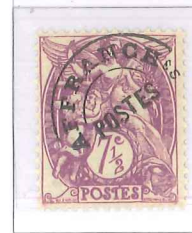
n° 42, 7½ c. lilas (II).