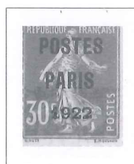
n° 32, 30 c. rouge.