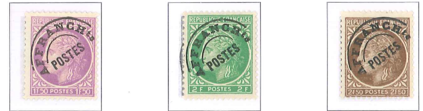
n° 91A, 1 f. 50, lilas. n° 92, 2 f. vert-jaune. n° 93, 2 f. 50, brun.