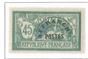
n° 44, 45 c. vert et bleu.