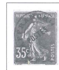
n° 62, 35 c. violet (I).