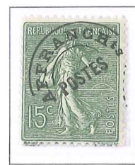
n° 45, 15 c. olive (IV).