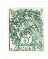
n° 41, 5 c. vert (IIA).