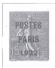
n° 31, 15 c. vert-olive.