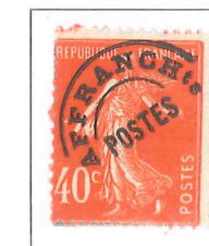
n° 64, 40 c. vermillon (II).