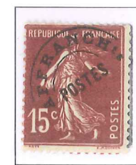
n° 53, 15 c. brun-lilas (I).