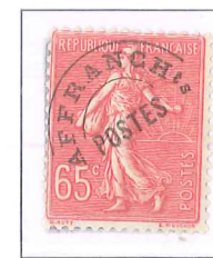
n° 48, 65 c. rose.