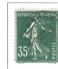
n° 63, 35 c. vert (II).