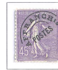
n° 46, 45 c. violet.