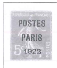
n° 30, 5 c. orange.