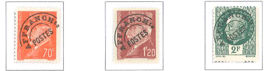
n° 84, 70 c. rouge-orange. n° 85, 1 f. 20, brun-rouge. n° 86, 2 f. vert.