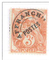
n° 39, 3 c. orange (I).