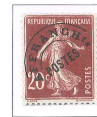
n° 54, 20 c. lilas-brun (III).