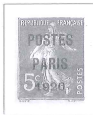
n° 24, 5 c. vert.