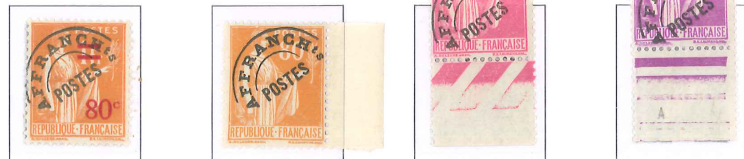
n° 74, 80 c. s. 1 f. orange (II). n° 75, 80 c. orange. n° 76, 1 f. rose. n° 77, 1 f. 40, lilas.