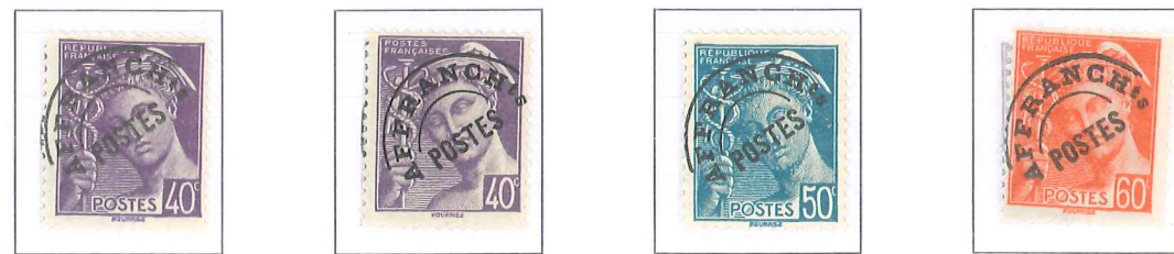
n° 80, 40 c. violet. n° 81, 40 c. violet. n° 82, 50 c. turquoise. n° 83, 60 c. rouge-orange.