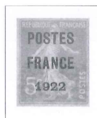
n° 36, 5 c. orange.