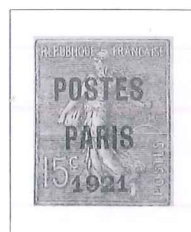
n° 28, 15 c. vert-olive.