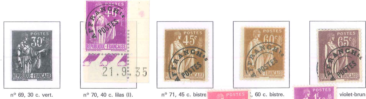
n° 69, 30 c. vert. n° 70, 40 c. lilas (I). n° 71, 45 c. bistre. n° 72, 60 c. bistre. n° 73, violet-brun.