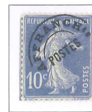
n° 52, 10 c. outremer (III).