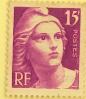
1945 Vignette expérimentale MARIANNE de GANDON