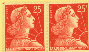
Vignette d'essai pour la fabrication du premier carnet vertical "de type distributeur" 1955