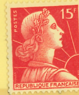
1955 Vignette d'essai (Typographie) pour le réglage des distributeurs de roulettes: Marianne de Muller