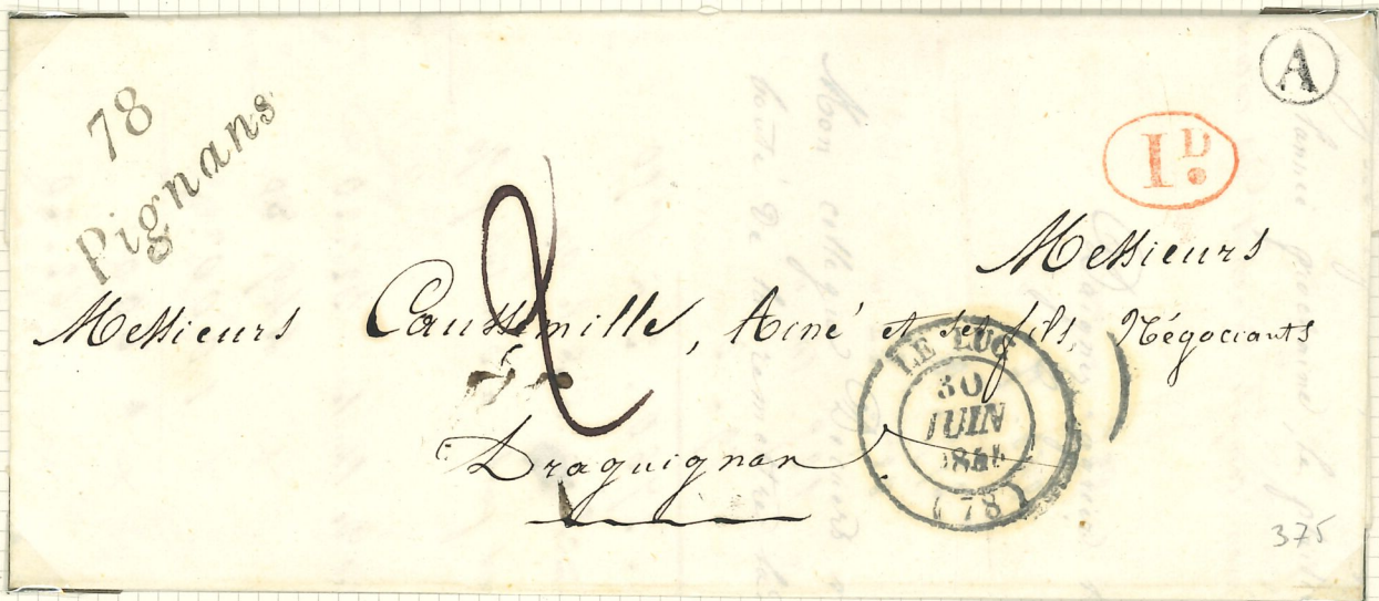
Cursive N°19 par le Luc cachet Type 14 1 re Distribution rouge Cachet de facteur A GONFARON

Même cursive Avec cachet de facteur B CARNOULES