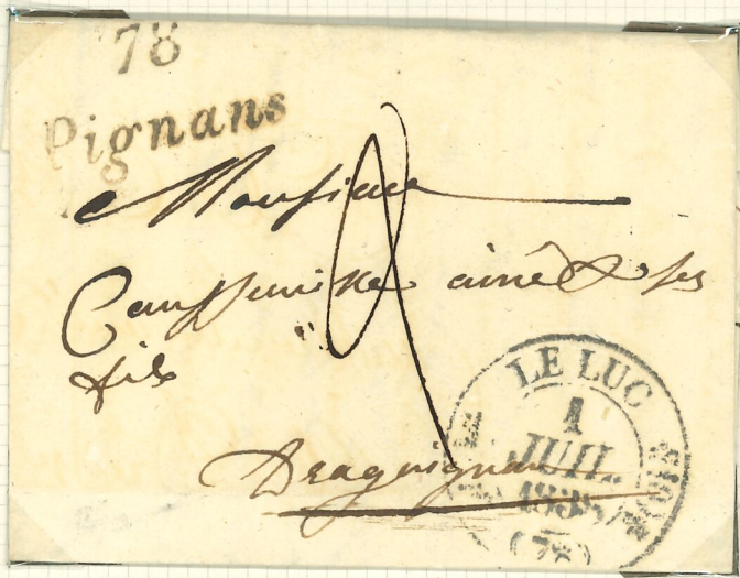
Cursive N°19 par LE LUC Cachet a date Type 11