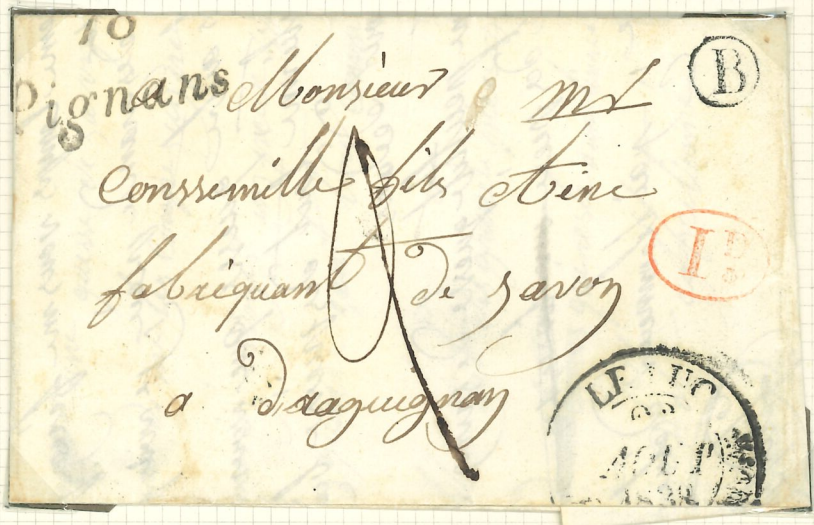
Cursive N°19 par LE LUC Cachet a date Type 11 Cachet de facteur B CARNOULES 1 re Distribution