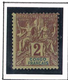
2c. lilas, brun 2/3 paille