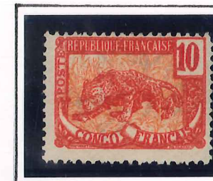
10c. brique et rose