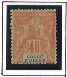
40c. rouge, orange