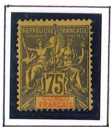
75c. violet 1/3 jaune