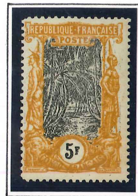
5F. jaune, orange et noir moutarde