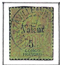
5 s/20c. brique 2/3 vert

1900. Timbres de 1892 surchargés Valeur 5 et 15.