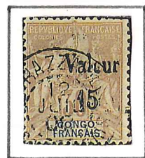
15 s/30c. brun