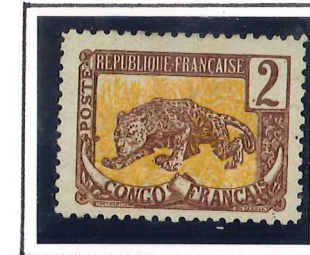
2c. brun et jaune