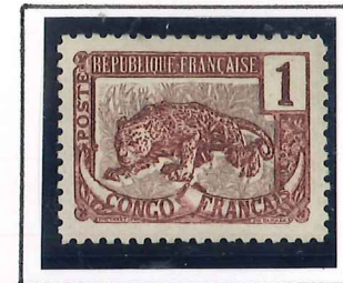
1c. brun, lilas et gris, lilas