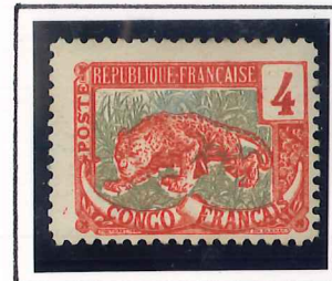
4c. rouge et ardoise