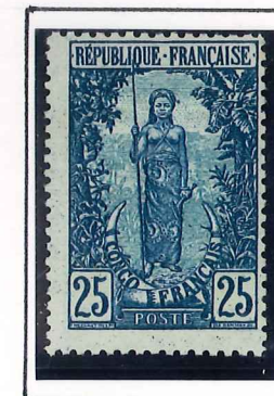
25c. bleu et bleu pâle