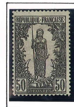
50c. violet et gris, viol.