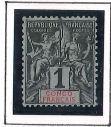
1c. noir 1/3 azuré