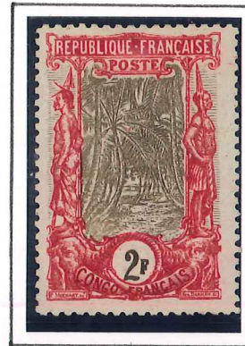
2F. carmin et brun