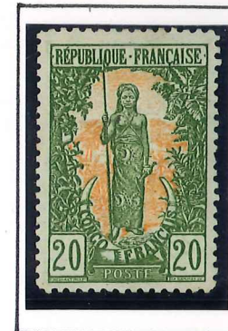
20c. vert et jaune, foncé