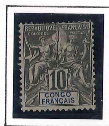
10c. noir 1/3 lilas