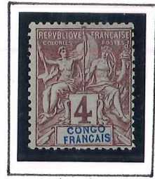
4c. lilas, brun 2/3 gris