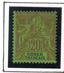
20c. brique 2/3 vert