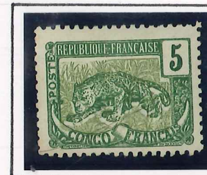
5c. vert et gris, olive