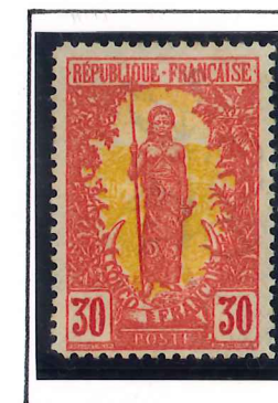
30c. brique et jaune