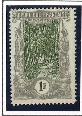
1F. gris et brun-olive

.1900.04. III. Type avenue des Cocotiers.