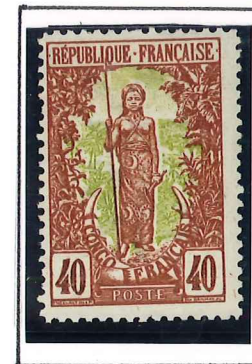
40c. brun et vert, olive