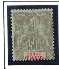
50c. bistre et azure