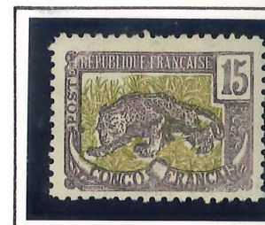
15c. violet et vert, olive