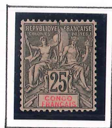
25c. noir 2/3 rose