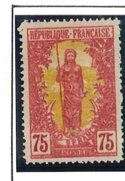
75c. lie de vin et jaune