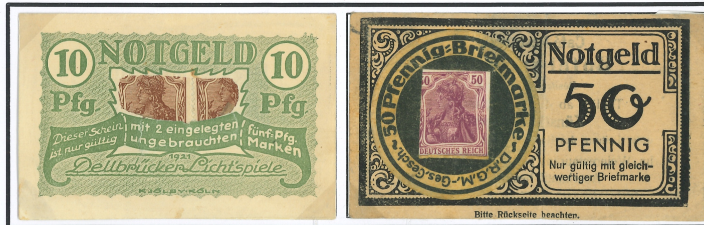
Billet-timbre de 10 pfennig (2x5 pf. brun), firme Kjölby à Cologne (publicités au verso).