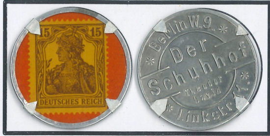
Timbre-monnaie avec 15 pfennig brun-lilas.

4 - Germania sur fond blanc & république / a. Allemagne