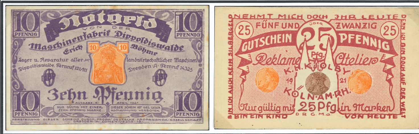
10 pfennig (10 pf. orange), atelier de construction mécanique à Dresde.

Billet-timbre pour utilisation locale, le ou les timbres postes sont toujours visibles grâce à une fenêtre découpée sur la face avant du billet.