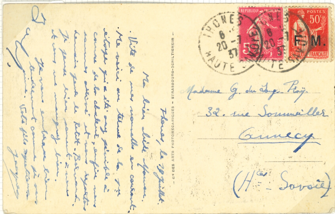
TARIF DU 12 JUILLET 1937 - CARTE POSTALE 55C