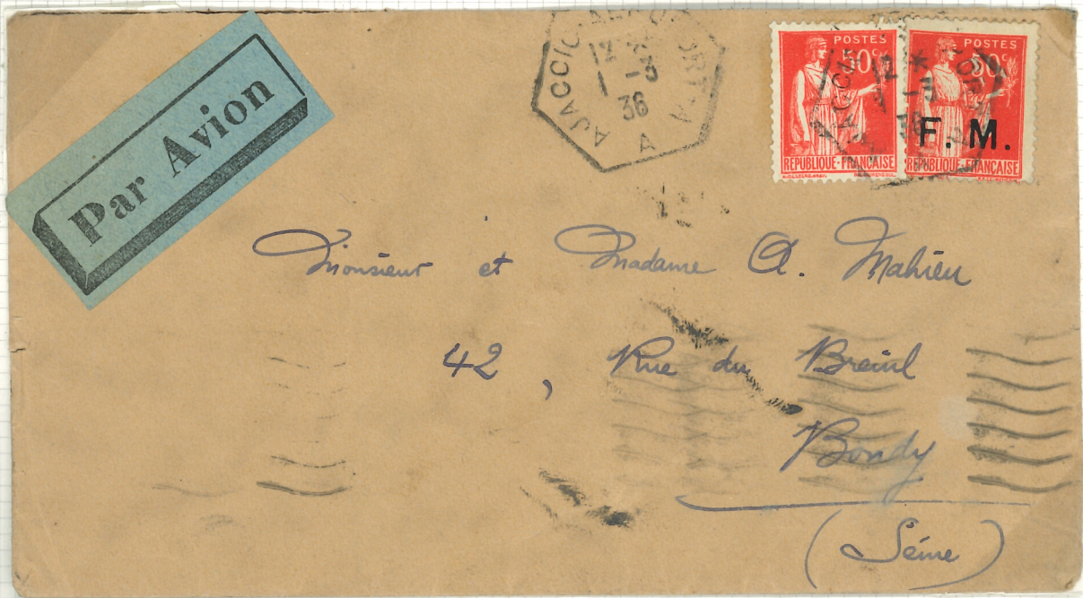
SURTAXE AERIENNE DEPUIS LA CORSE : 25C