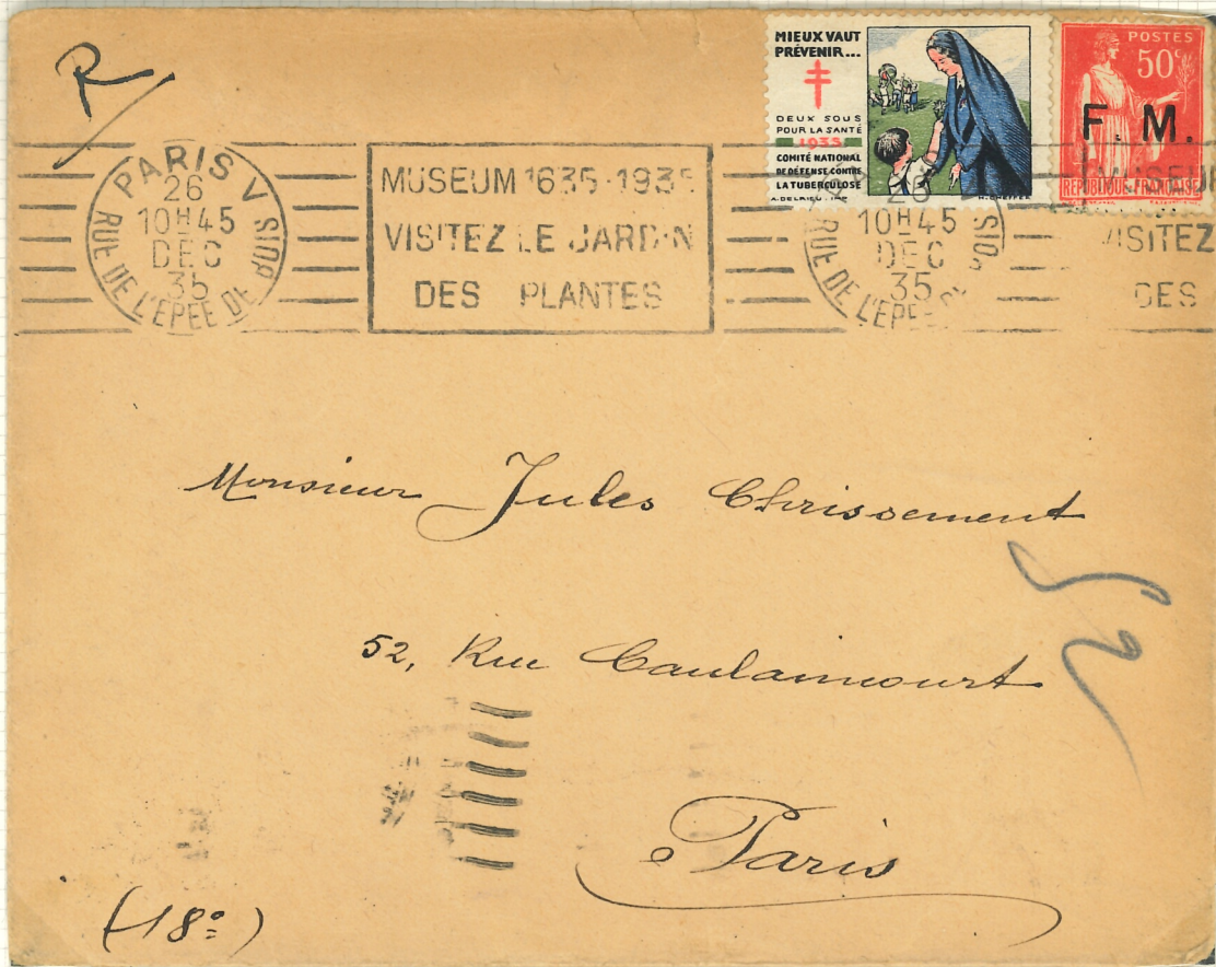
FM + VIGNETTE