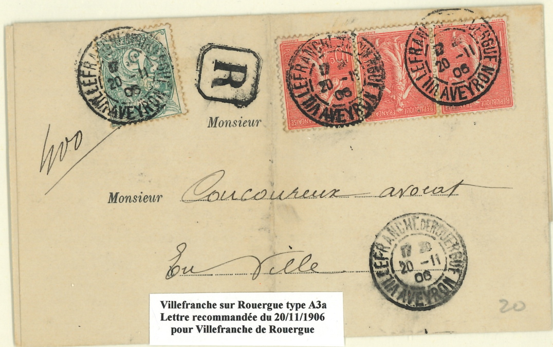
Villefranche sur Rouergue type A3a Lettre recommandée du 20/11/1906 pour Villefranche de Rouergue