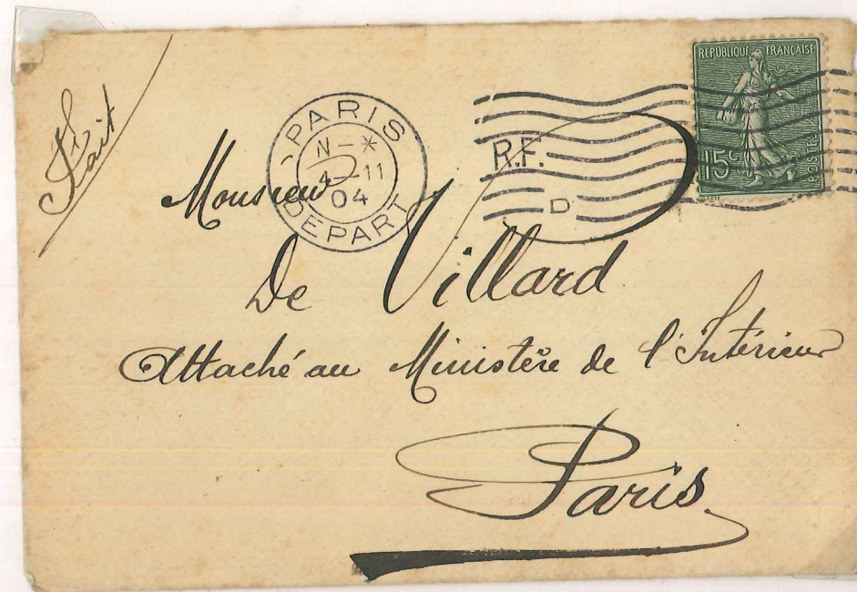
Oblitération mécanique FLIER avec 7 lignes ondulées sur une lettre affranchie à 15 cts type 4. La lettre D signifie déposée au guichet. Dans le cachet "PARIS DEPART 4/11/04" lettre N du bloc dateur (la lettre est partie de nuit).