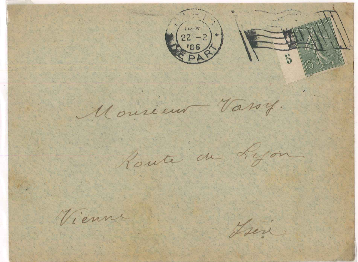
Oblitération mécanique drapeau blanc R.F et le cachet "PARIS DEPART ".La lettre est affranchie à 15 cts type 4.Millésime 5 tenant au timbre.