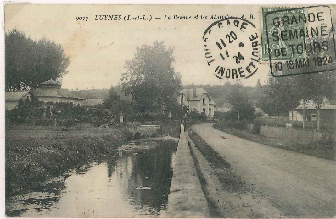
DAGUIN avec texte publicitaire à droite concernant " LA GRANDE SEMAINE DE TOURS 10-18 MAI 1924, avec le cachet TOURS GARE sur carte postale affranchie à 15cts type 3.