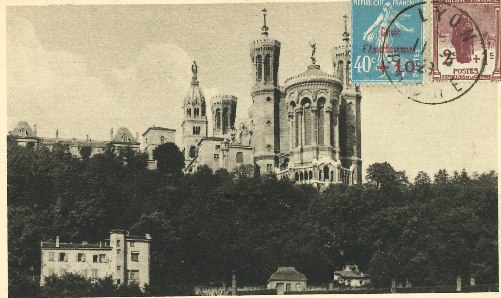
24 LYON. — Notre-Dame de Fourvière. — L'Abside. — LL.