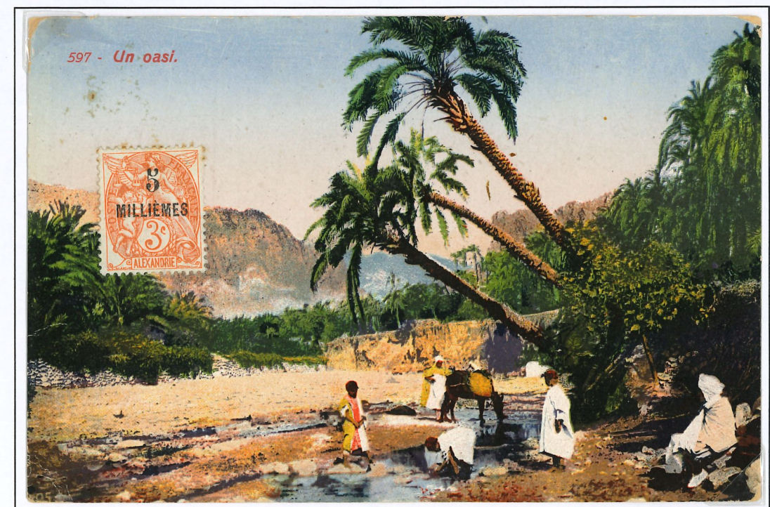
C.P. avec un timbre de la première surcharge dite de Paris. (1921)