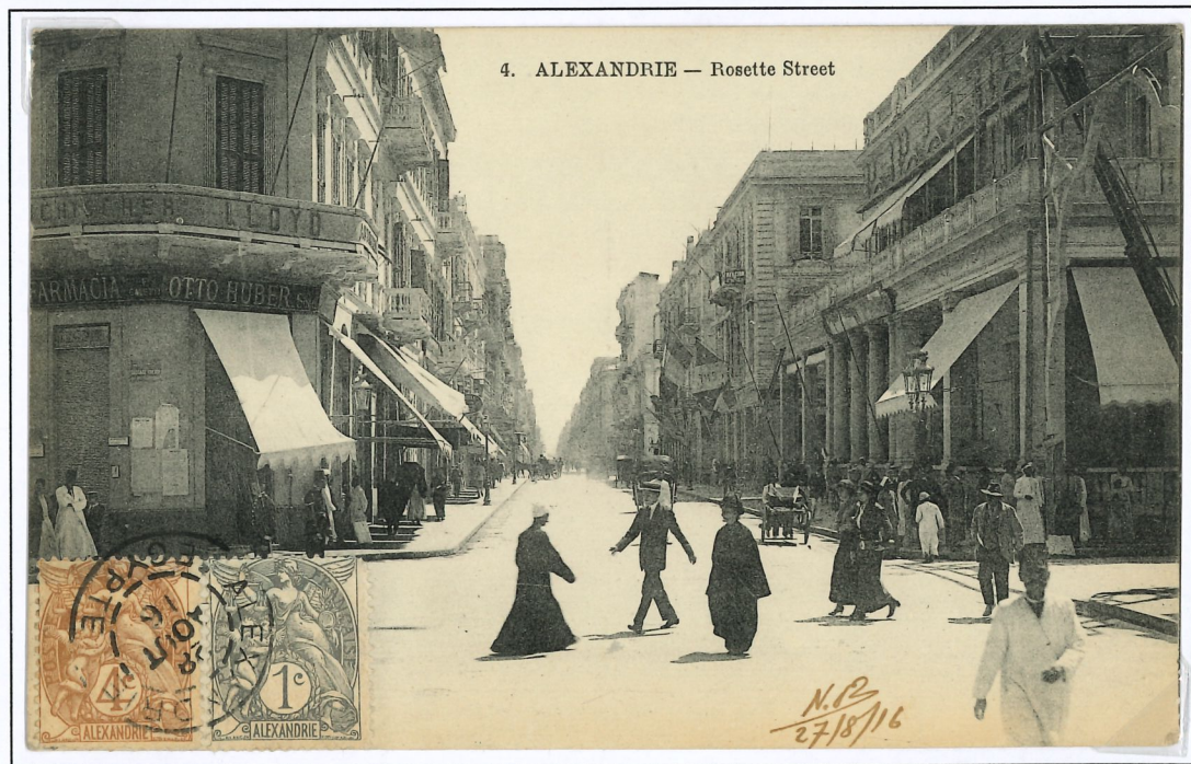
Carte postale du 26/08/1916 avec un affranchissement multiple composé d'un timbre à 1 c et un à 4c. Timbres oblitérés avec un cachet dateur de type 84 des bureaux de l'étranger.