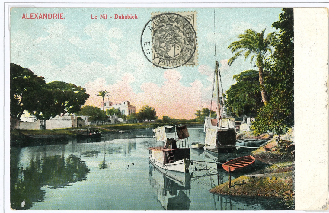
Carte postale (C.P.) du 22 Juin 1909 avec un timbre à 1 centime. Oblitérée avec un timbre à date de type 01 des bureaux de l'étranger.