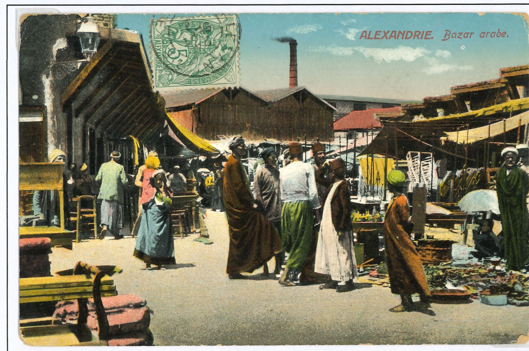
Carte postale affranchie avec un timbre de 5 centimes au tarif de moins de 5 mots. Oblitéré par TàD des bureaux de l'étranger type 84.