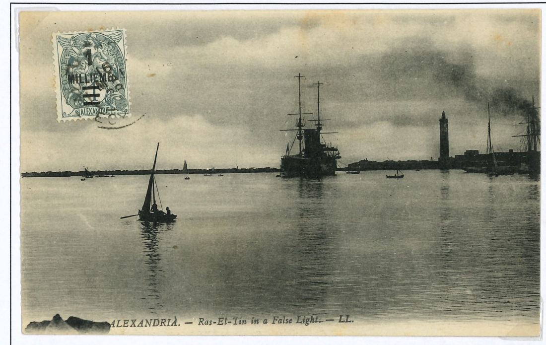
Carte postale avec un timbre de la deuxième surcharge de Paris (1925) ou trois traits horizontaux barrent la valeur initiale du timbre.