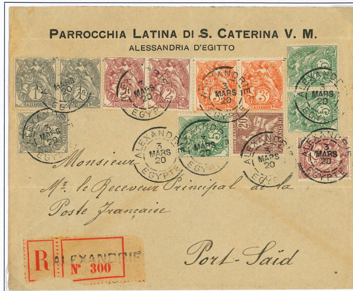
Lettre recommandée expédiée d'Alexandrie le 3 Mars 1920 vers Port-Saïd et arrivée le 4 Mars à destination avec un affranchissement multiple entre-autre de timbres au type Blanc. Montant de 50c soit 25c pour un affranchissement au deuxième échelon de poids et 25c pour la taxe de recommandé.

Le bureau Français a été fermé le 31 Mars 1931.