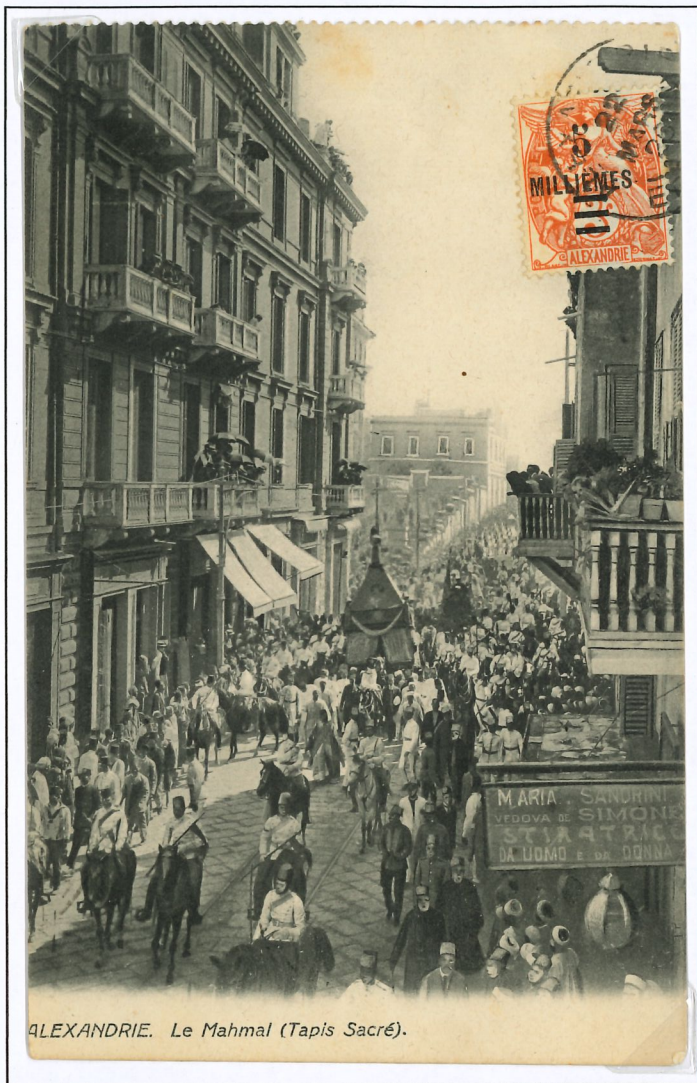
Cartes postale affranchie avec un timbre avec la surcharge de 1925 oblitéré par un TàD type 84 des bureaux de l'étranger.