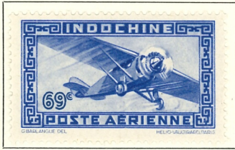
1944. — Type de 1933-38 sans r. f. Dent. 13½.