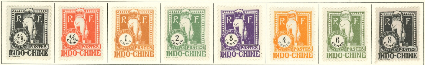
1922. — Type de 1908. Valeur en noir. Dentelés 14 x 13 1/2.