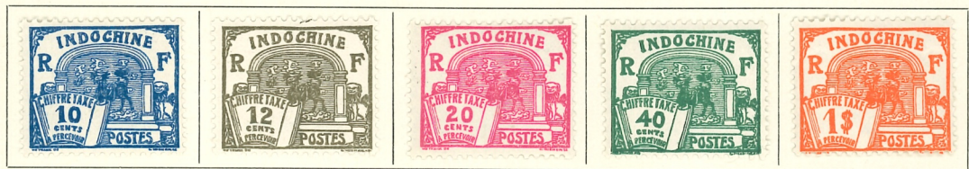
1931-41. — Inscriptions. Valeur en noir. Dentelés 13 1/2 x 13.